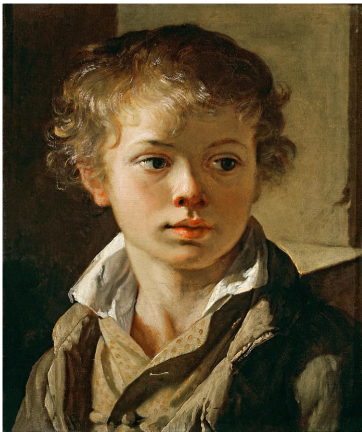
Художник Тропинин «Портрет сына»

Портрет- жанр живописи, в основе которого лежит изображение конкретного человека с ярко выраженной индивидуальностью. Слово портрет означает в переводе с французского языка «воспроизводить черта в черту» изображаемого человека. Портрет всегда рисуется с натуры. Художник выбирает человека, которого хочет изобразить, придает ему красивую позу, иначе говоря, просит позировать. Перед художником стоит сложная задача- передать внешний облик человека, его лицо, фигуру, движение, костюм, обстановку в которой он находится. Но главная ценность этого жанра в том, что он нам передает не только внешний вид человека, но и его характер, настроение, его внутренний мир.