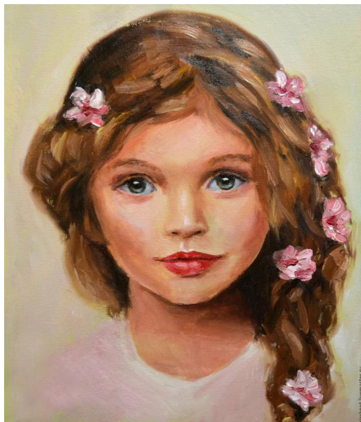
Портрет девочки (масло)