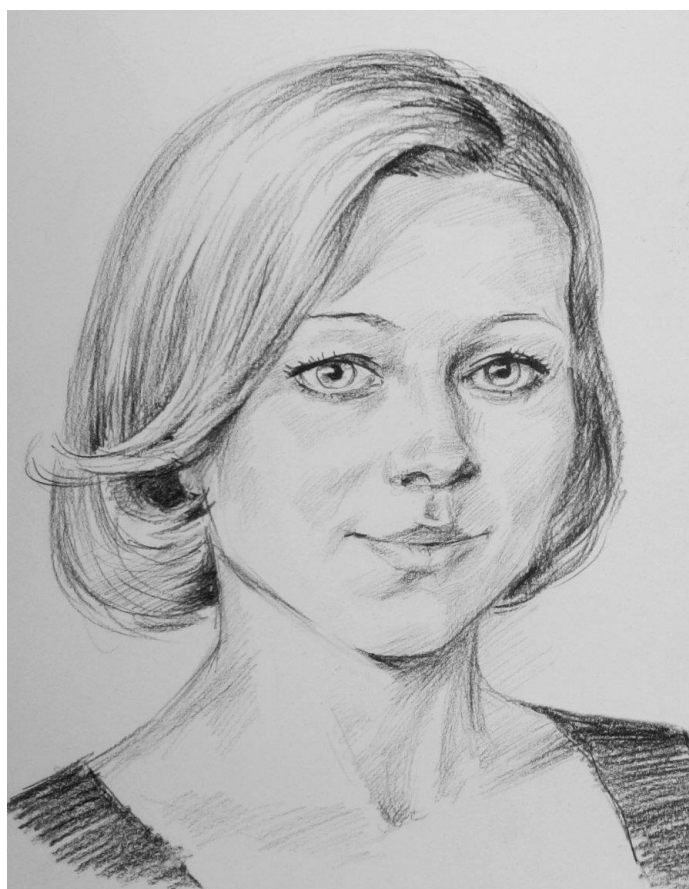
Портрет девушки (карандаш)